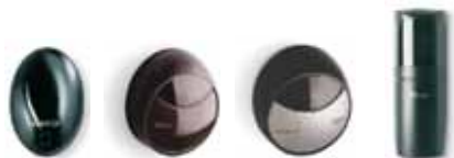
BF MOF MOFB F210 (FT210)