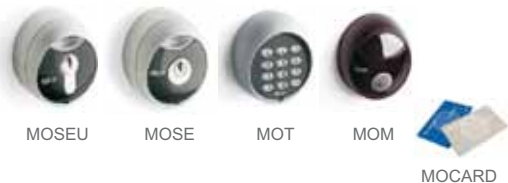
MOSEU MOSE MOT MOM MOCARD