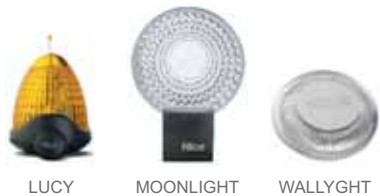
LUCY MOONLIGHT WALLYGHT